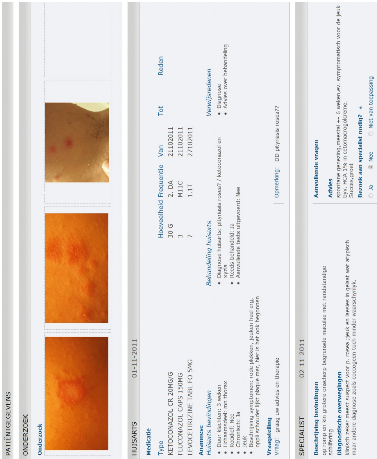
FIGUUR 1 Een beeldschermoverzicht van een teledermatologieconsult.